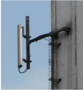
Figur 1 – M-type 3