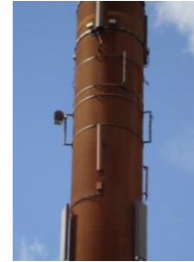
Figur 3 – M-type 6

Ved montering af bærerør eller antenne direkte på gavl eller facade, se Figur 1, Figur 2 og Figur 3, skal følgende sikres: