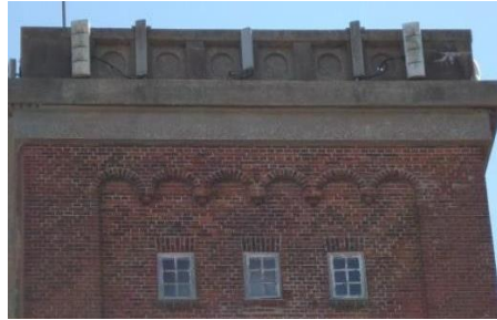
Figur 2 – M-type 6