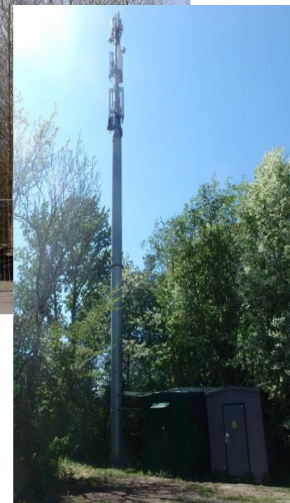
KK1 + CC1 Monopole, Rørmaster eller stålskorstene der ved svigt IKKE kan kollideres med bebyggelse eller større færdselsårer/ befærdede områder, f.eks. som illustreret ved en monopole ved en øde opbevaringsplads eller i kanten af et bevokset areal.