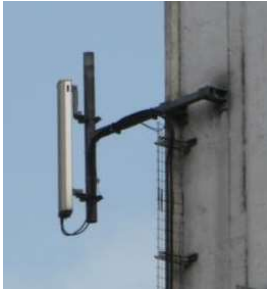
Figur 1 – M-type 3