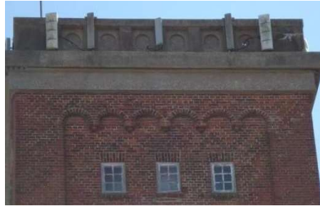
Figur 2 – M-type 6