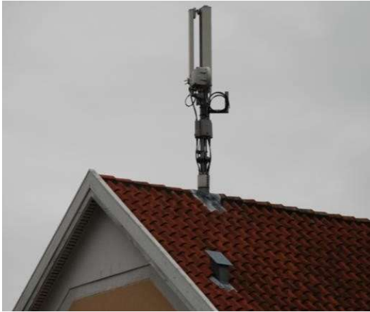
Figur 1 – M-type 1

Ved montering af antennesystem på bærerør på tag med rejsning, som vist på Figur 1, skal følgende sikres: